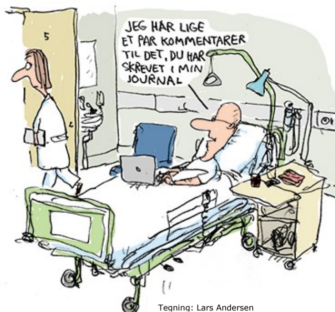
Tegning: Lars Andersen

http://www.rkkp.dk/okonomi/bogholderi-og-regnskab/